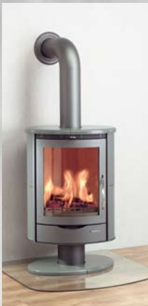
Sella Keramikverkleidung schiefer