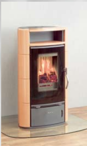
Pizzo Keramikverkleidung apricot