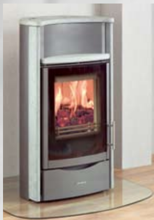
Pago Compact Natursteinverkleidung