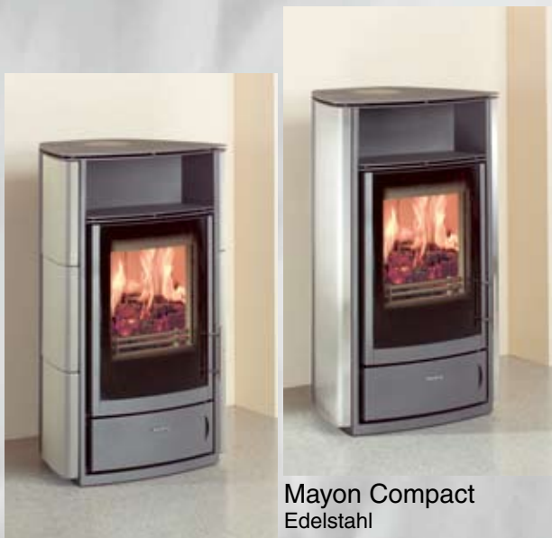
Mayon Compact Edelstahl