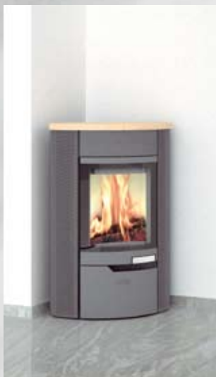
Kone Lochblech-Design, ahorn