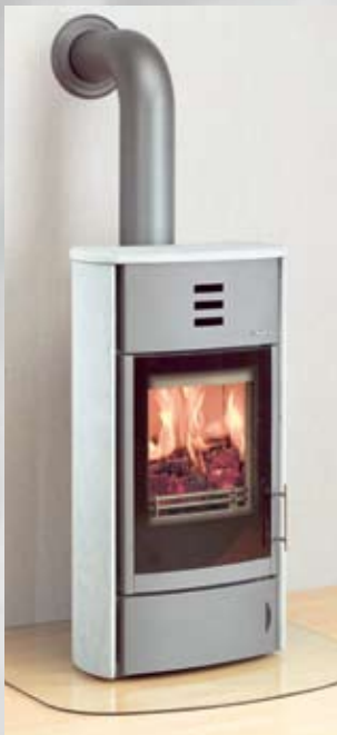
Agando Compact Natursteinverkleidung